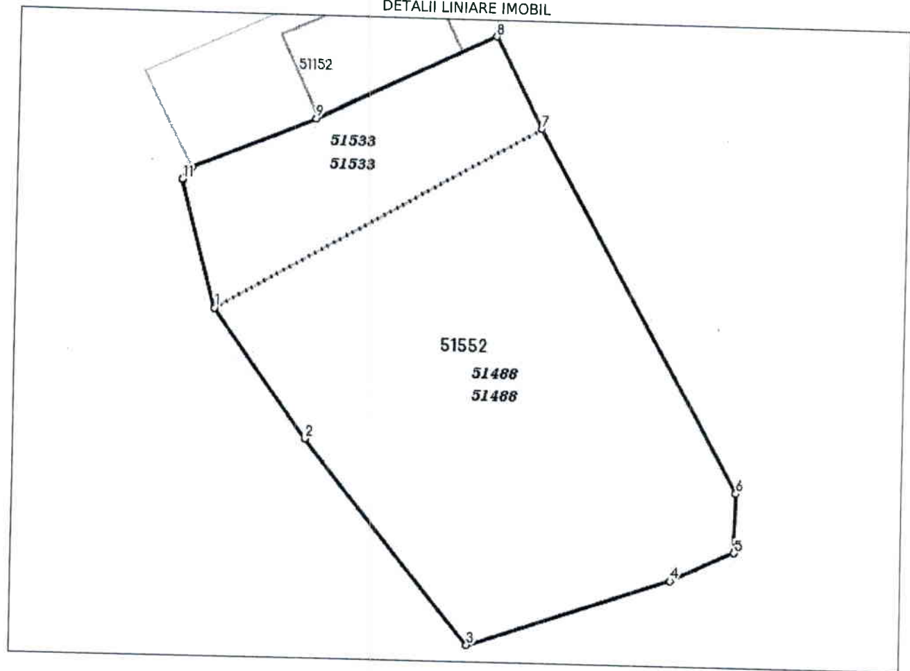
DETALII LINIARE IMOBIL

* Suprafața este determinată in planul de proiecție Stereo 70.