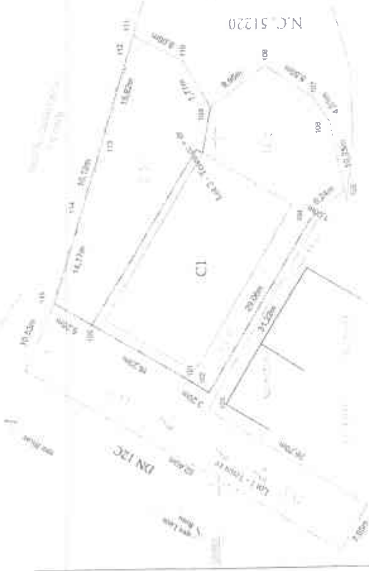
Tabel de incercare procedurii pentru alipire terenuri